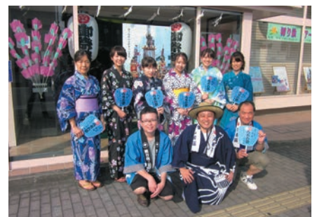
うちわ祭りに参加した石原支店職員