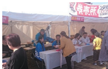
チケットを販売する職員