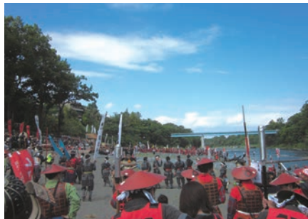
寄居北條まつりの様子