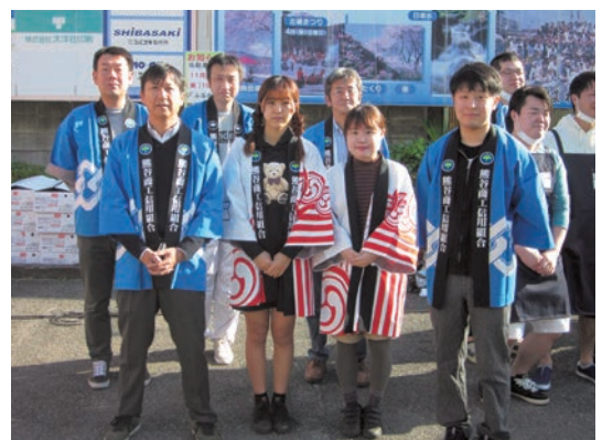
ふるさと祭典市に参加した寄居支店職員