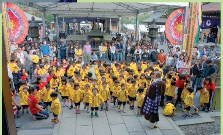
妻沼聖天山 重文祕仏御本尊御開扉の様子