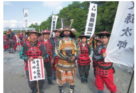
参加した寄居支店職員