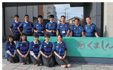
ラグーシャツを着用した本店営業部職員