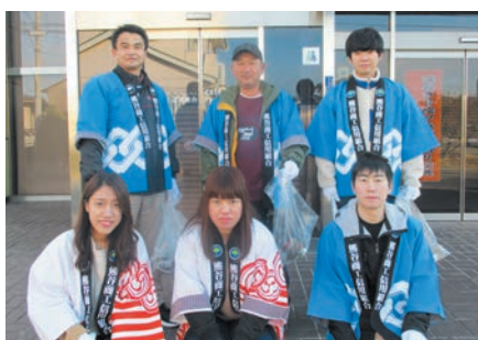
清掃活動に参加した川本支店職員