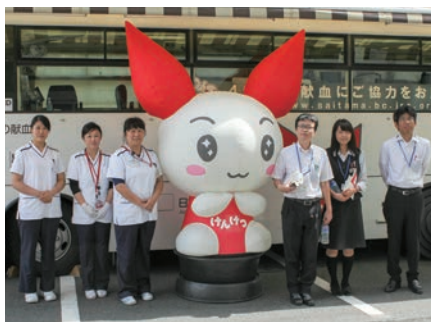
献血に参加した職員と日本赤十字社の皆さん

今回はくましの職員26名が受付を行い献血に協力しました。今後も当組合は「愛の献血運動」に積極的に参加してまいります。