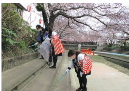
清掃活動する吹上支店職員

今回も、平成30年5月27日「春のゴミゼロ運動」平成30年11月25日「秋のゴミゼロ運動」の年2回の清掃活動に参加致しました。