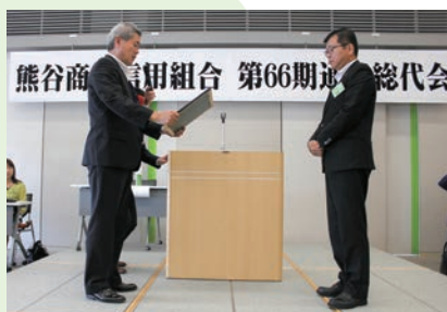
熊谷市より感謝状をいただきました