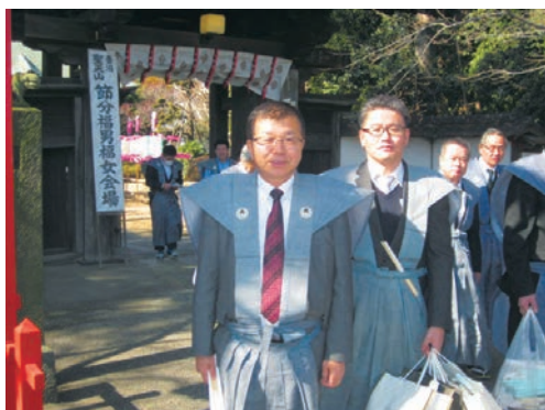
節分会に参加した理事長と妻沼支店長

特設舞台からは、大勢の福男、福女が豆まき、福まきを行い、境内には「福は内、鬼は外」の声があちこちから聞こえ、その年の福にあやかろうと、大勢の方々がつめかけ、終日賑わいます。