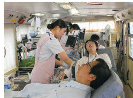
献血に協力する職員