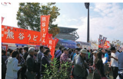
第8回うどんサミットの様子

また北海道から九州まで32の参加店が自慢のうどんを競い合い、来場者の投票により今回のグランプリは地元熊谷の“熊谷うどん”（埼玉県）に決定いたしました。昨年僅差で2位となったりリベンジを果たしました。当組合の職員も当日のチケット販売を担当、2日間頑張って売りまくりました。今年は熊谷市で開催される最終年度となりますので11月16日、17日の2日間は今まで以上にチケット販売頑張ります。