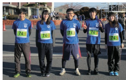
駅伝に出場した行田支店職員

第32回熊谷めめま駅伝大会が平成31年1月26日（土）熊谷市の妻沼中央公民館を発着点として、利根川堤防沿いの5区間13.8キロのコースで開催されました。行田支店では「全員がベストを尽くす！」をスローガンに休日に練習を重ね出場いたしました。皆様の温かいご声援のおかげもあり、一般混成の部で無事完走を果たすことが出来ました。くましんは地元根差す金融機関として、今後も地域行事に積極的に参加して参ります。