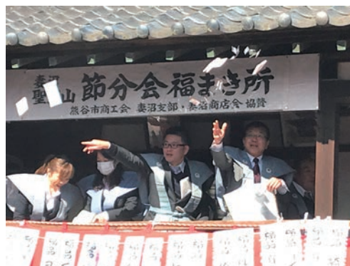
豆をまく理事長と妻沼支店長