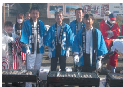
サンマを焼く寄居支店職員

秋の味覚の代名詞である「サンマ焼き」も開催。開催年に合わせ2,018匹のサンマが宮城県・女川町から届き、お客様の胃袋を満足させておりました。この「サンマ焼き」に、くましん職員も法被を着て、参加いたしました。サンマの焼ける煙に涙を潤ませながら上手(?)にサンマを焼き、ご来場の皆様に喜ばれました。