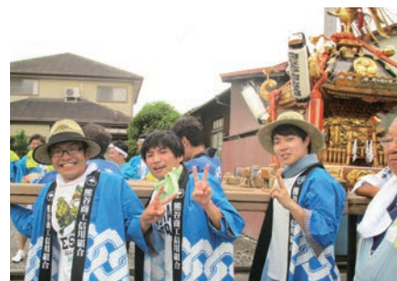
お祭りに参加した行田支店職員

7月の最終土・日曜日に行われるこのお祭りは名物である「だんべ踊りパレード」を中心に山車のお囃子やミニステージ等も開催され、地元の皆様に親しまれています。お祭り当日、行田支店では地域貢献活動の一環として、地区の御神輿を担がせて頂き、地域の方々と親交を深めました。