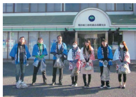
清掃活動に参加した花園支店職員