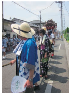
石原支店職員が曳く、屋台