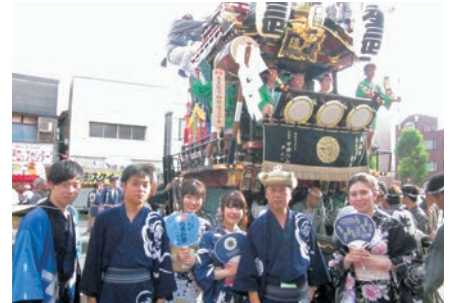
うちわ祭りに参加した本店営業部職員

くましんでは、本店営業部・石原支店の職員がそれぞれの地区の皆さんと祭りの期間中一緒に山車・屋台を曳き、また女子職員も浴衣を着て地域の方々と一緒に“熊谷うちわ祭り”を盛り上げています。