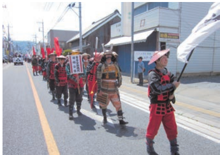
鎧を纏いパレードする職員

祭り当日は、鎧武者が出陣し、市街地パレードや戦国時代の合戦さながらの攻防戦が繰り広げられました。今回、寄居支店長が大將役を務め、壇上で「えいえいおー」の勝どきをあげ、祭りを盛り上げました。またくましん寄居支店職員7名(男子5名・女子2名)も戦国時代の鎧兜を纏い武者隊として市街地内パレードに参加致しました。