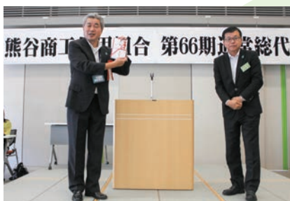
ラグビーワールドカップ2019島村推進室長